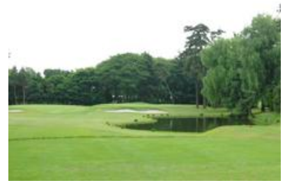
小田急藤沢ゴルフクラブ

2013年6月17日(月)に、第四回東京北星会会長杯ゴルフコンペが神奈川県での定例コースの名門パブリック 小田急藤沢ゴルフクラブにて開催されました。梅雨に入り雨も心配されましたが、メンバーの日頃の行いが良く、晴れ渡る青空の下でのプレーとなりました。