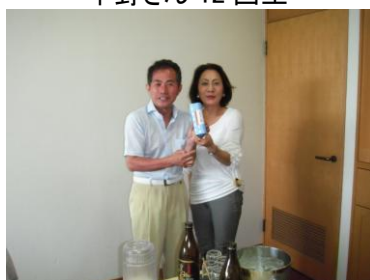
ドラコン・ニアピン宮崎さん