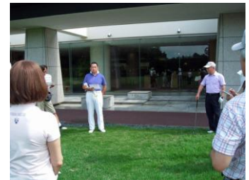
大会ルールの説明風景